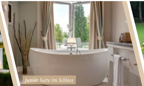
Junior Suite im Schloss