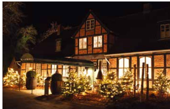
Während der Feiertage ist das ganze Resort festlich illuminiert. So auch das Kavaliershaus, das mit eigenem Winterzauberwald begeistert.

Diese Arrangements sind ausschließlich telefonisch unter +49 (0) 4382 9262 1717 oder per E-Mail unter reservierung@weissenhaus.de buchbar. Wir empfehlen Ihnen, frühzeitig zu reservieren, da die Anfrage hoch und die Kontingente begrenzt sind.